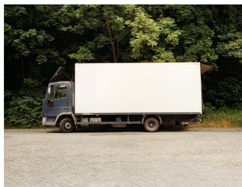
Bernard Fuchs, Weimar , 2005 © Galerie Ilka Bree

L'ensemble de la collection de l'artothèque, qui a débuté en 2002, est porté à plus de 500 œuvres.