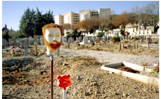
Anne Laure Boyer, Tête d'Etude , 2006

La mise en place d'actions de médiation, d'animations et de conférences à destination de tous les publics vient compléter naturellement cette démarche originale et novatrice.